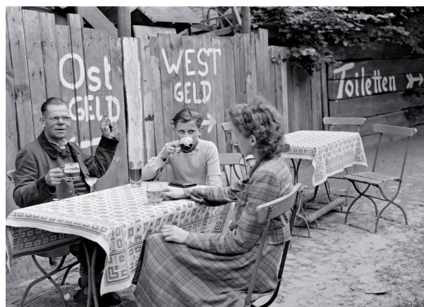
Życie Niemców w sektorowej rzeczywistości Berlina, przed budową muru, lata 50.

Zjednoczenie Niemiec nie osłabiło, wbrew obawom, zajmowania się nazistowską przeszłością. Zakończenie zimnej wojny i dwupaństwowości niemieckiej stworzyło jednak nowe warunki i problemy. Niemcy są jedynym krajem w Europie, który doświadczył dwóch totalitaryzmów i konieczności uporania się z ich konsekwencjami. Po zjednoczeniu w 1990 r. zderzyły się dwie odmienne kultury pamięci. Nowym centrum zainteresowań stało się porównywanie obu dyktatur.